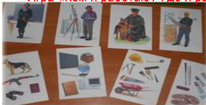
Игра «Кому что нужно для работы»