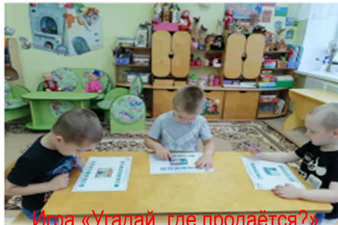
Игра «Угадай, где продаётся?»