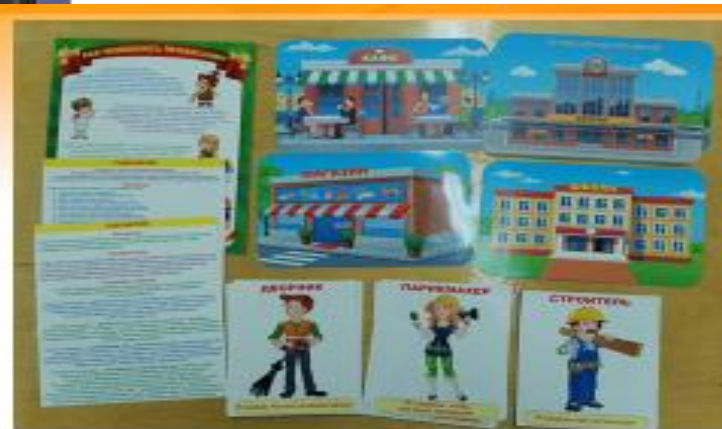
Игра «Кем я работаю? Где я работаю?»