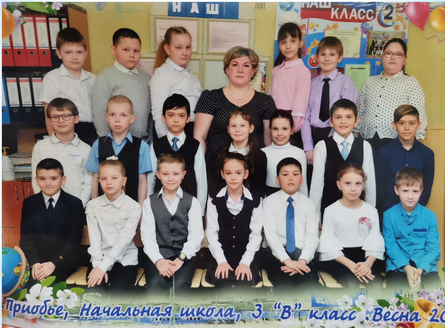
Приобье, Начальная школа, 3 "В" класс. Весна 20