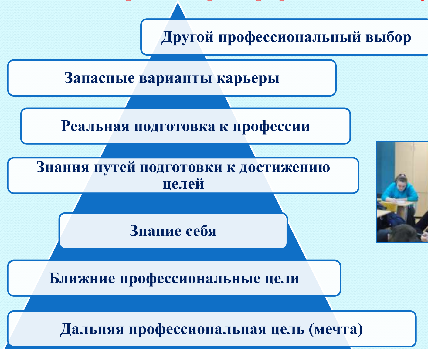
Схема построения образа профессионального будущего