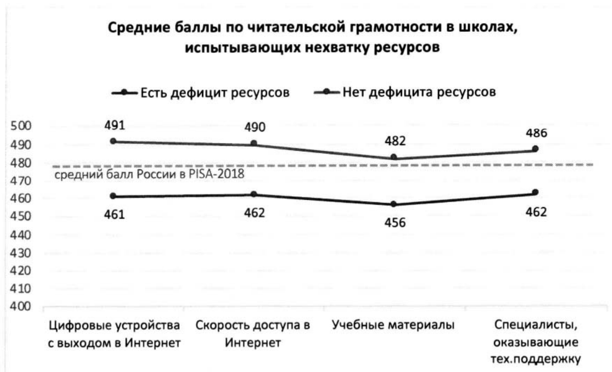
Рисунок 2. Дефициты ресурсов образовательной организации и результаты обучающихся по шкале читательской грамотности PISA относительно среднего результата РФ в PISA-2018

Дефициты ресурсов определялись на основании ответов администрации школ на вопросы анкеты и могут отражать субъективную точку зрения директора.